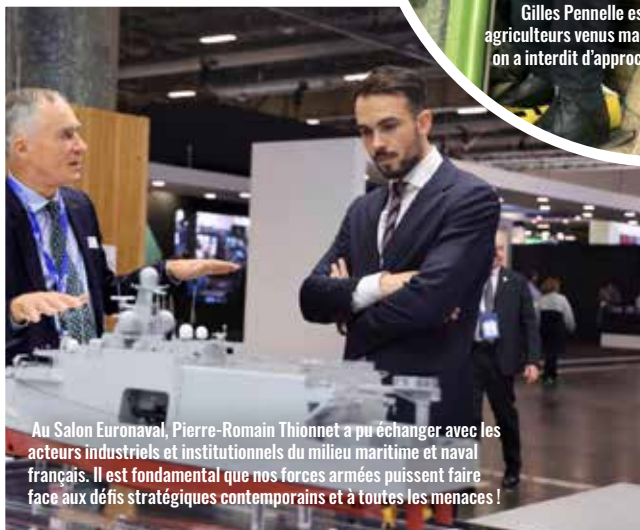
Au Salon Euronaval, Pierre-Romain Thionnet a pu échanger avec les acteurs industriels et institutionnels du milieu maritime et naval français. Il est fondamental que nos forces armées puissent faire face aux défis stratégiques contemporains et à toutes les menaces !