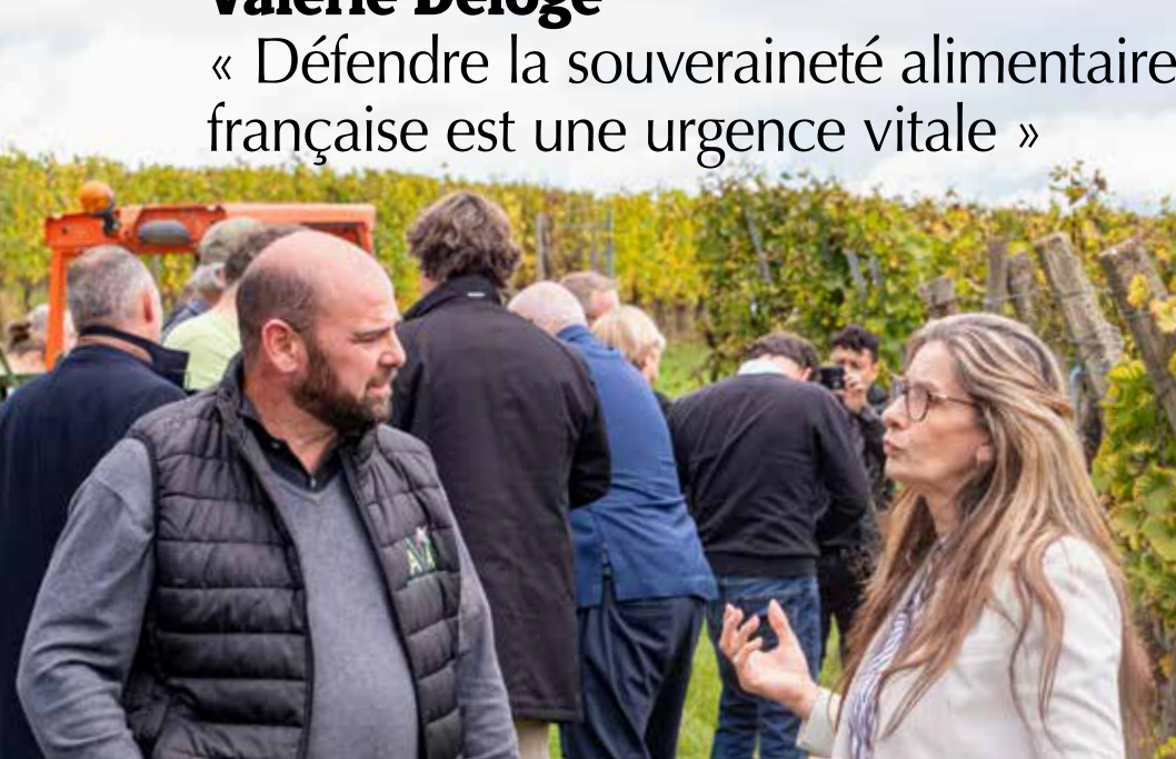
◀ Valérie Deloge, député européen, membre de la commission AGRI, elle-même agricultrice, va à la rencontre de nos producteurs. Ici avec des vignerons alsaciens.

« Défendre la souveraineté alimentaire française est une urgence vitale »