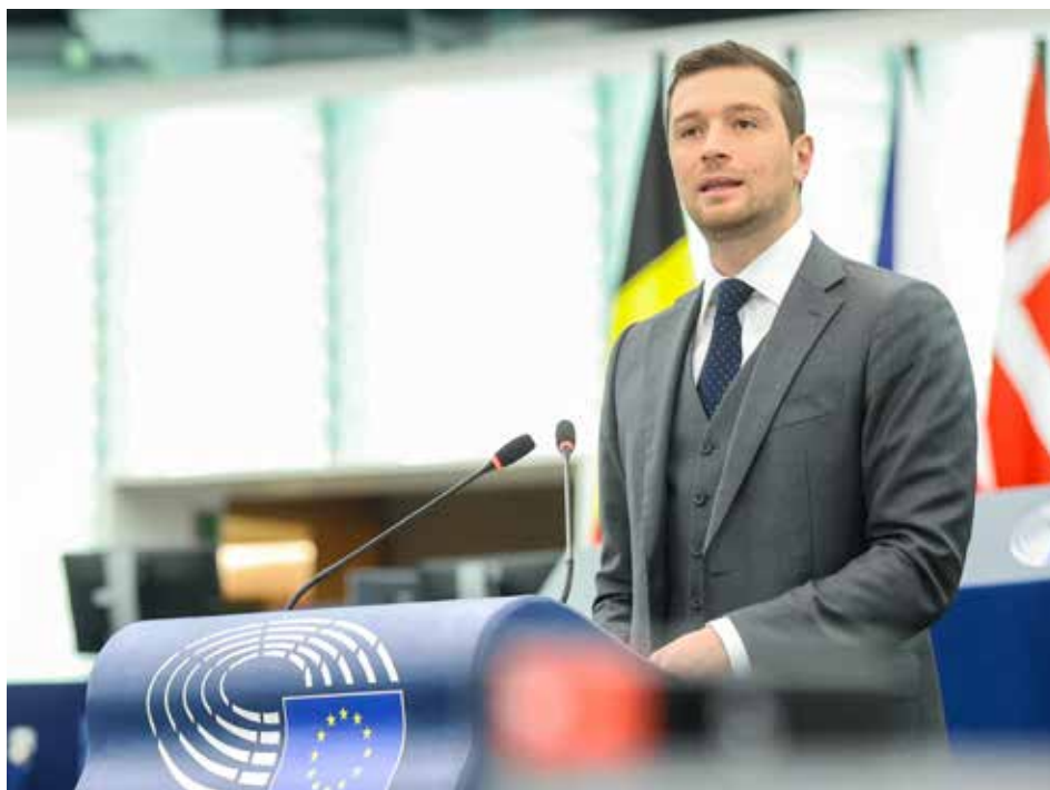
Jordan Bardella à la tribune du Parlement européen de Strasbourg, le 12 février 2025

Réveillons-nous, ou nous risquons de sortir de l'histoire et de disparaître. ■